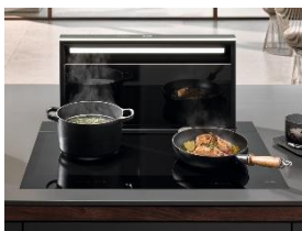
Foto 1: Stimmungsvolle Lichtakzente: Das umlaufende LED-Lichtband des Downdraft-Dunstabzugs Levantar Ambient sorgt für eine atmosphärische Küchenbeleuchtung – auch während des Kochens.