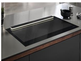
Foto 3: Im Ambiente-Modus fährt der Wrasenschirm des Dunstabzugs Levantar Ambient nur wenige Zentimeter aus. Für eine wirkungsvolle und dezente Beleuchtung ohne Absaugfunktion.